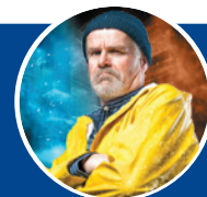
Yannick Le Spécialiste Sac Resist.